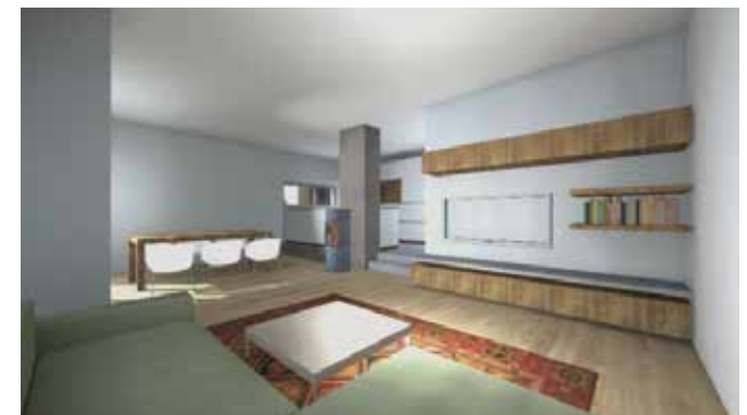
Entwurfsansichten - Änderungen im Detail möglich