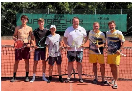
Herren 3. Klasse