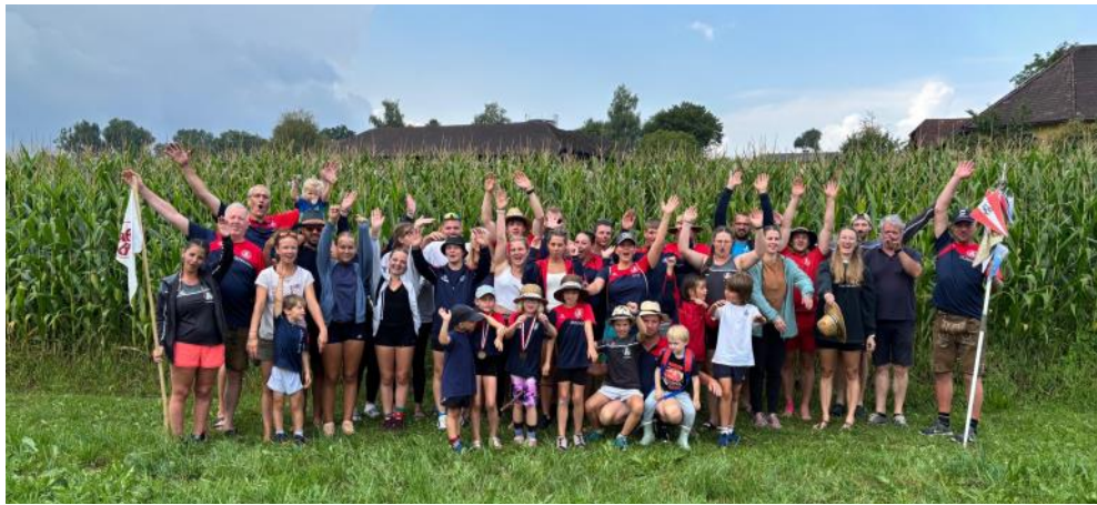
Bericht: ÖTB Brunnenthal

Nach einer Woche voller schöner Erlebnisse blicken wir stolz auf eine gelungene 61. Auflage zurück und freuen uns schon auf das nächste Jahr: 2026 führt uns die Jahnwanderung nach Münzkirchen!