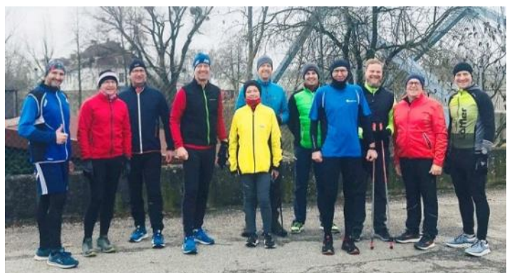
Berichte: Alois Fasthuber