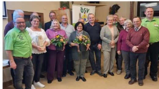
Gruppenfoto aller geehrten Mitglieder - für 20, 40 und 45-jährige Vereinszugehörigkeit.

Zahlreiche Gäste folgten den interessanten Beiträgen der Versammlung. Zudem gab es Ehrungen langjähriger Mitglieder.