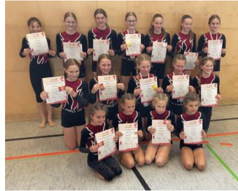
Bericht: Union Brunnenthal