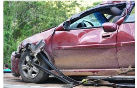
Bericht: FF Brunnenthal

Falls ihr uns weiterhelfen könnt, bitte unter der Telefonnummer 0676/82 12 34 531 melden. Danke!