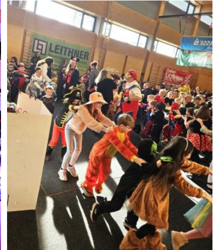
Berichte: FF Brunnenthal