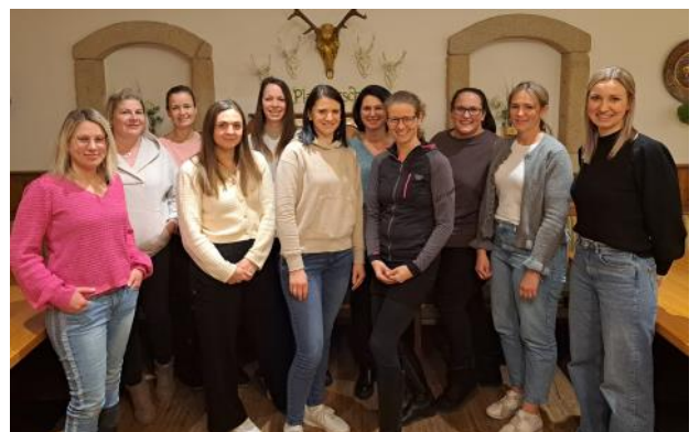
Bericht: Elternverein Brunnenthal