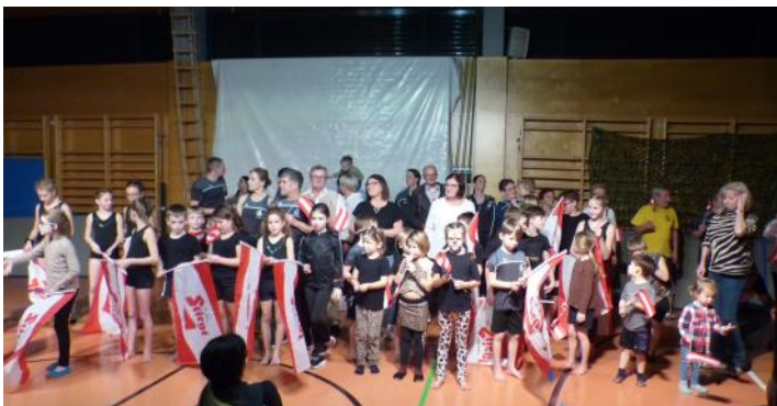
Berichte: ÖTB Brunnenthal

Es war ein gelungenes Schauturnen und die Turnerinnen und Turner waren sehr stolz auf ihre Leistungen!