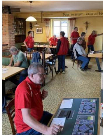
li.: „Genaueres Arbeiten an der Schaltzentrale“

Ein besonderer Dank geht an die Sponsoren, die uns hier wirklich super mit den von ihnen zur Verfügung gestellten Preisen unterstützten.