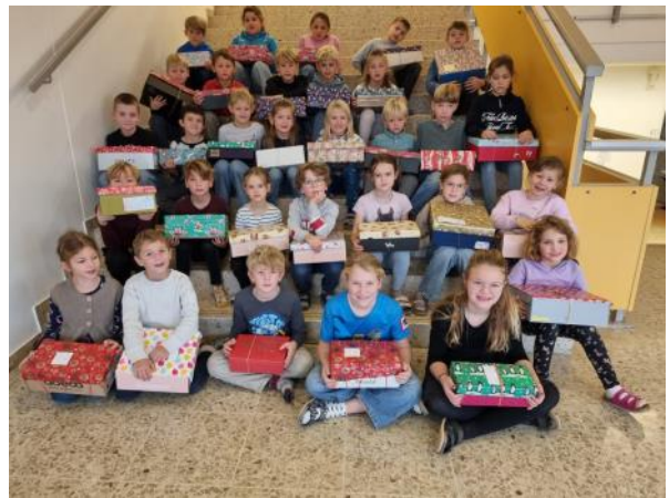
Bericht: VS Brunnenthal

Da es auch in Europa Menschen gibt, die in großer Armut leben, beteiligt sich die Schule seit vielen Jahren an der Aktion " Weihnachtsfreude ". Dabei bepacken die Kinder mit ihren Eltern Schuhschachteln mit Dingen des täglichen Bedarfs, sowie mit kleinen Überraschungen, die einem Kind Freude machen. So kann sich die Weihnachtsfreude auch in die ärmsten Teile Europas ausbreiten!