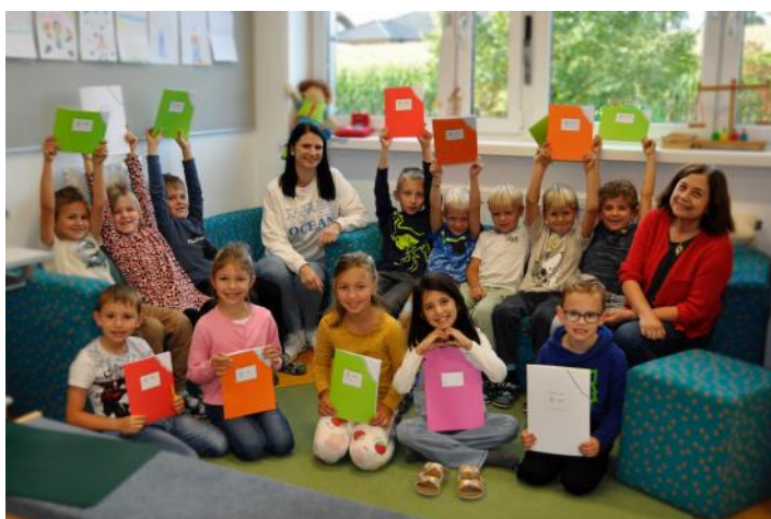
Berichte: Monika Widegger

Der Elternverein gratuliert den Schülerinnen und Schülern der beiden 4. Klassen zur erfolgreich bestandenen Fahrradprüfung .