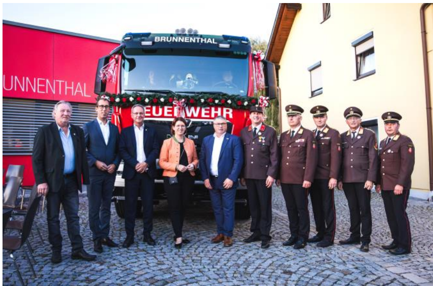
Bericht: FF Brunnenthal

Die Feuerwehr Brunnenthal bedankt sich für den zahlreichen Besuch an den beiden Festtagen. Ein besonderer Dank ergeht an die vielen ehrenamtlichen Helferinnen und Helfer, ohne die ein Fest dieser Größenordnung nicht möglich gewesen wäre.