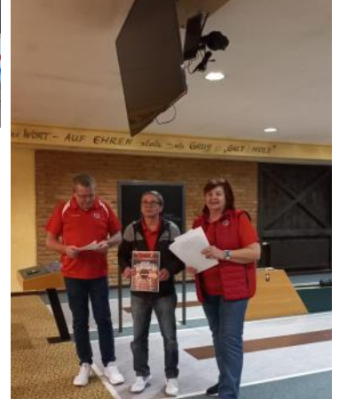
re.: 12. Platz für die Mannschaft Brunnenthal